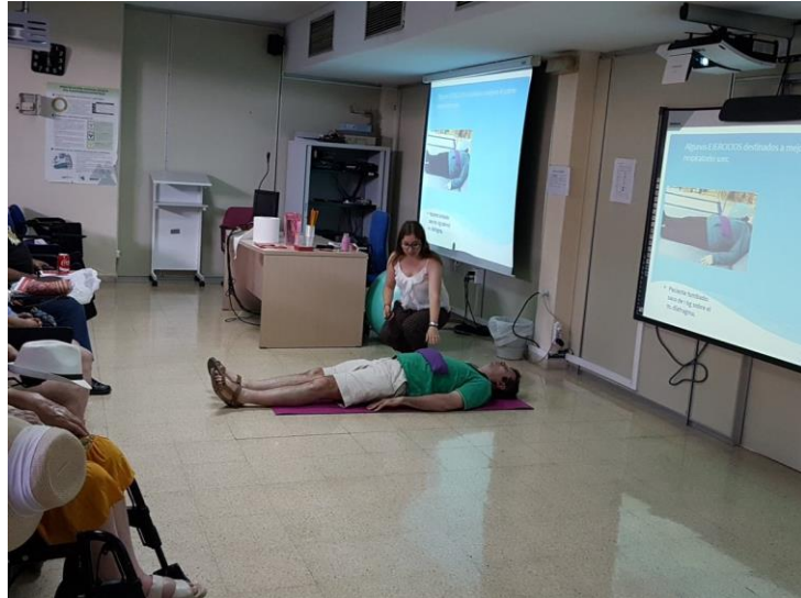
🐦 Hacemos otro ejercicio de respiración diafragmática #EsclerosisMultiple